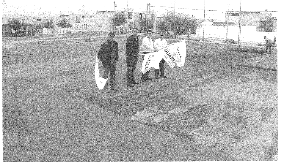
Construcción de cancha.