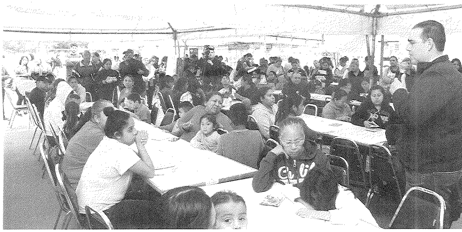
Diálogo con los vecinos.

calles a pie, donde platicó con los vecinos, atendió sus peticiones y los invitó a que lo acompañaran a la brigada medico asistencial que llevó hasta